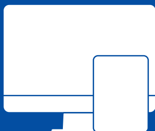
2 www. ideuromedia. ru